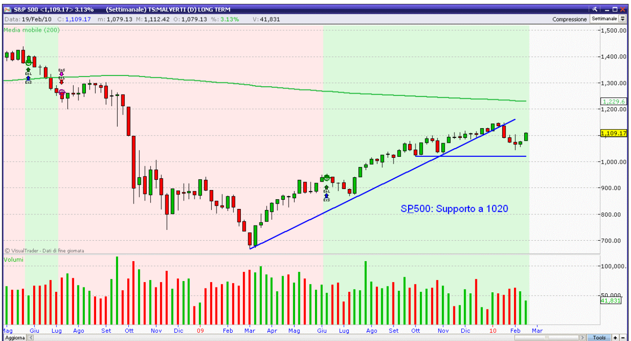
Fig. 3. S&P500 : Sale e si riporta verso i massimi.