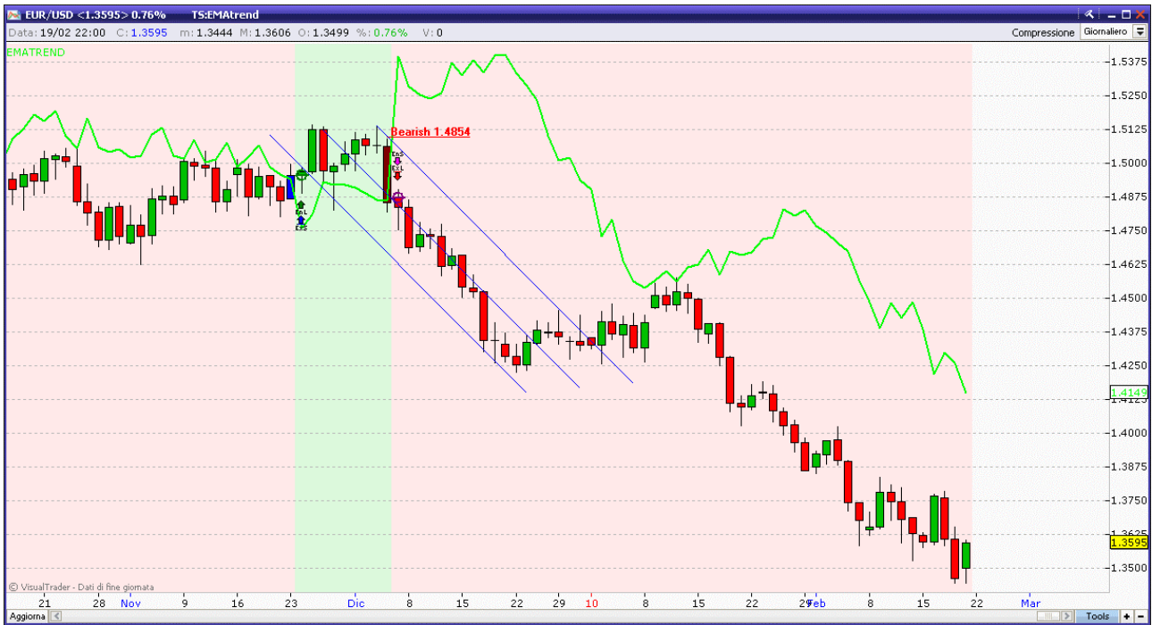
Fig. 4. Euro-dollaro: Nessun segnale d'inversione.