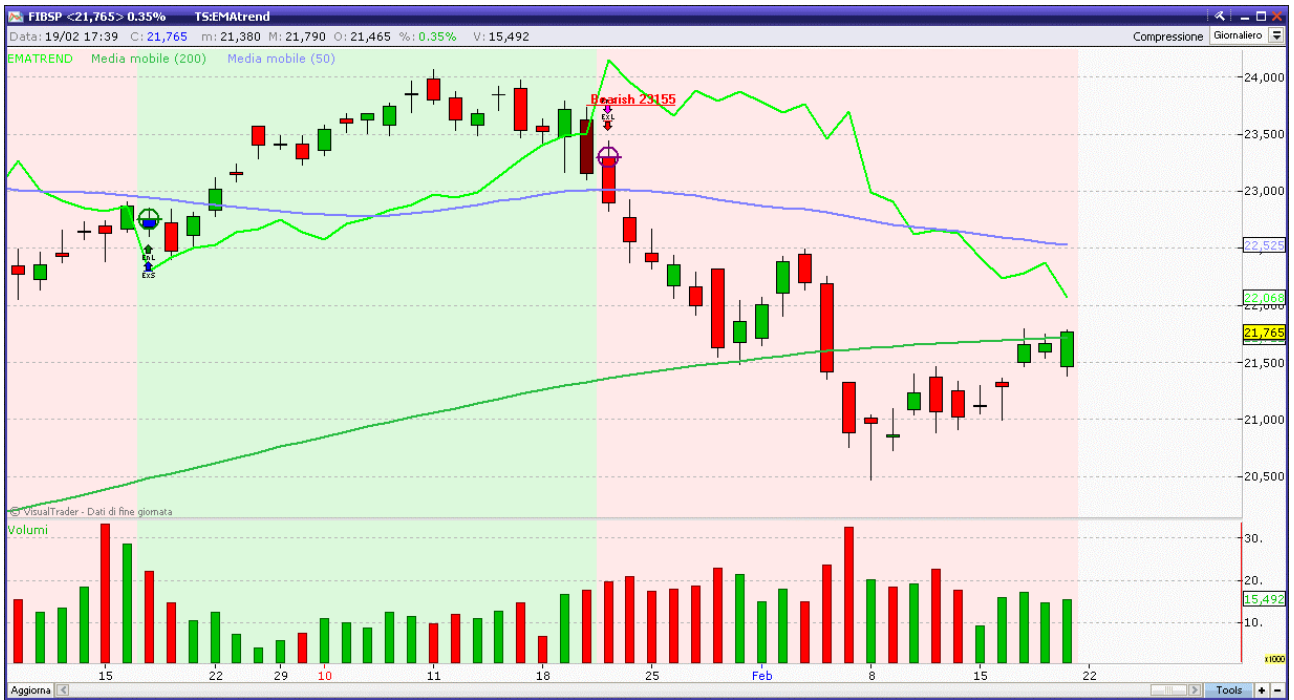
Fig. 2. FTSE Mib a barre giornaliere. Modesto recupero anche se è presto per segnali long su ottica daily (resistenza > 22500).