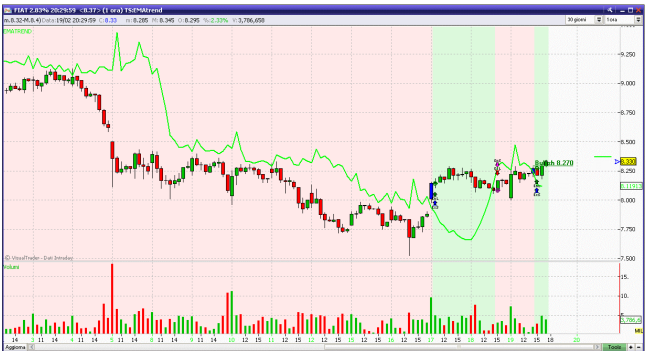
Fig. 5. Fiat: Resistenza in area 8.40.