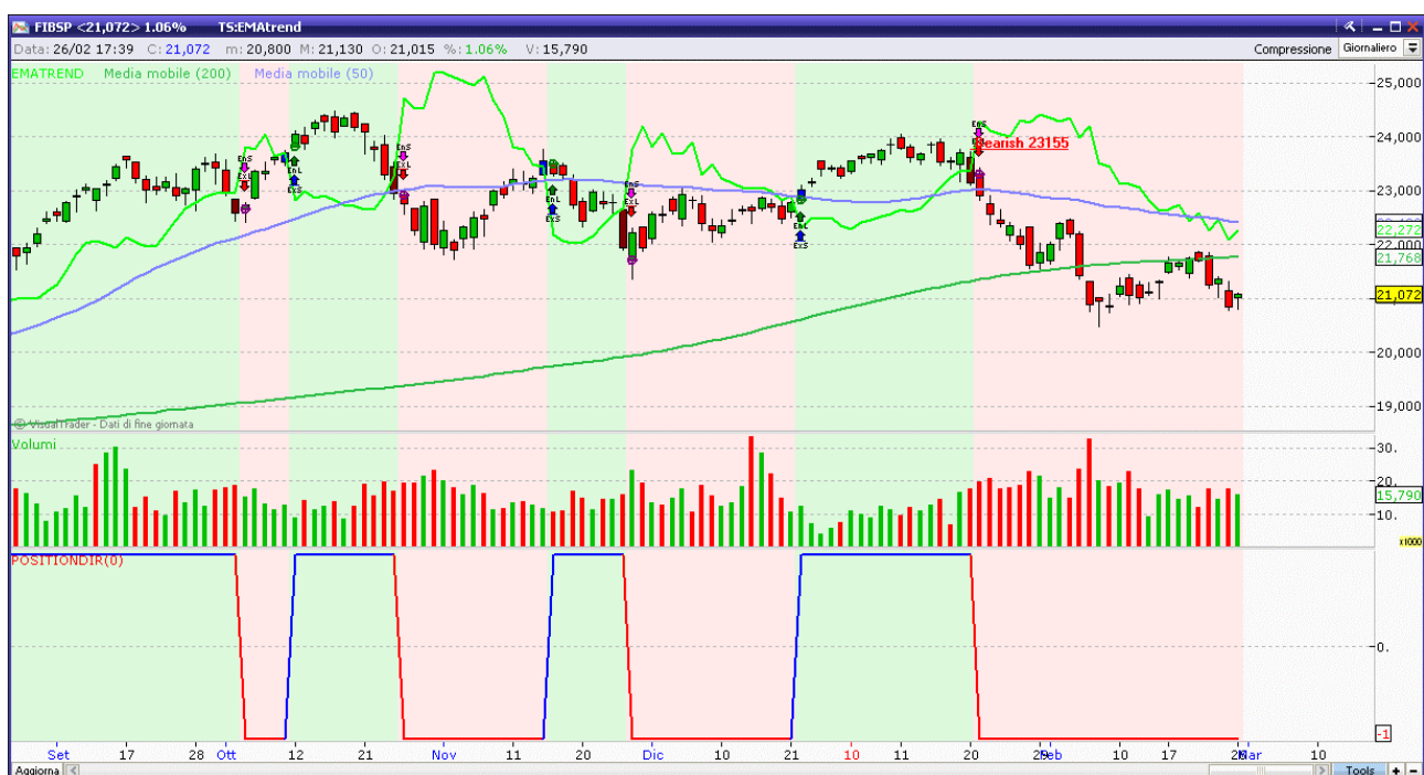
Fig. 1. FTSE MIB : "Ematrend" su candele orarie del FTSE Mib. Siamo di nuovo in prossimità dei minimi.

29, 30, 31 Maggio a Comano Terme, 2 do Master di analisi quantitativa, info su www.enricomalverti.com o tel info line: 011-535739