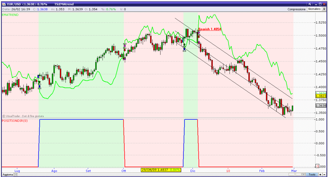
Fig. 4. Euro-dollaro : Ha arrestato la sua discesa ma non ha ancora invertito. Resistenze a 1.3750 e 1.3876.